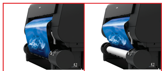
El sistema multifunción de alimentación de material en rollo de la Serie PRO es opcional para el modelo PRO-4100S y viene estándar con el modelo PRO-6100S.

Por primera vez, una impresora imagePROGRAF puede cargar y reconocer el papel sin la necesidad de una intervención humana. Simplemente, coloque el sujetador de rollos en la impresora y el material se alimentará automáticamente en la impresora. El sensor múltiple integrado mide el reflejo de la superficie y el grosor del material para determinar el tipo de material.