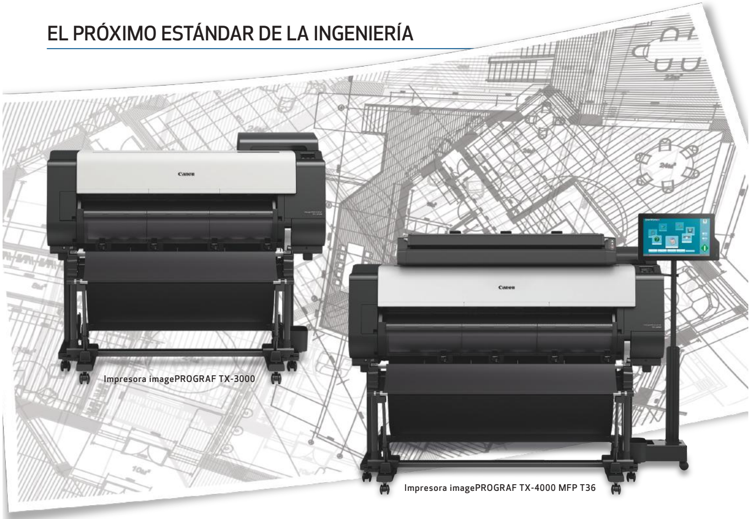
Impresora imagePROGRAF TX-3000