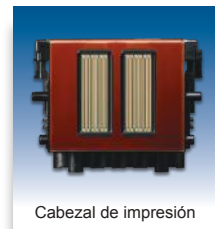
Cabezal de impresión

Debido a que la cultura de hoy exige más con menos, Canon ahora ofrece soluciones multifacéticas avanzadas para el mercado de impresión de documentos técnicos y de alta producción.