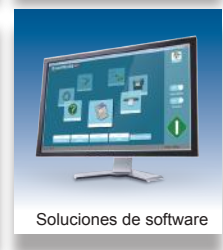
Soluciones de software