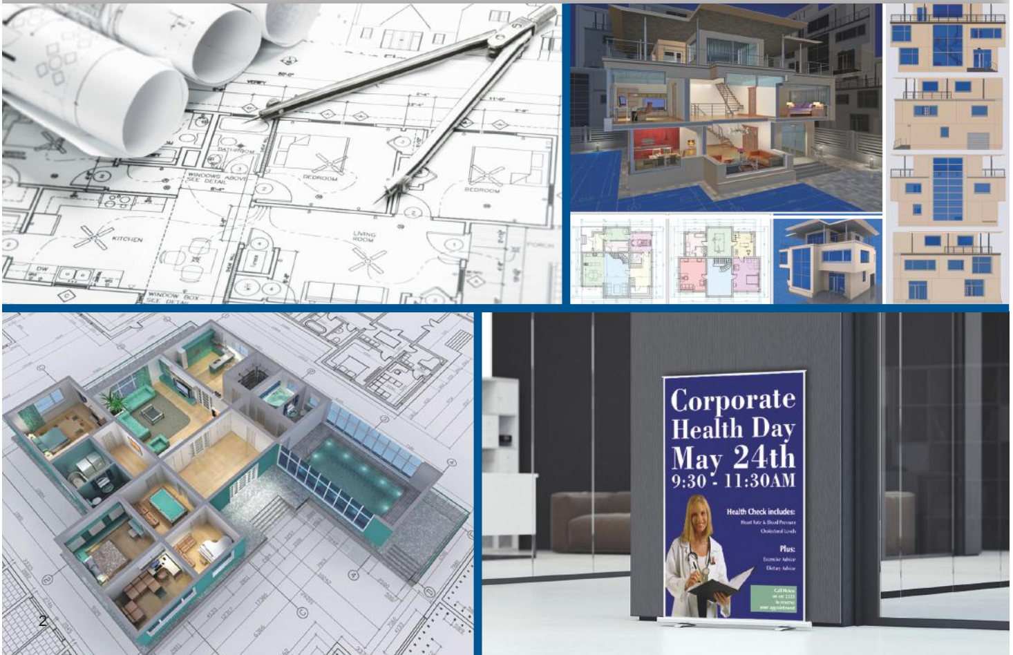
Impresora imagePROGRAF TX-4000 MFP T36