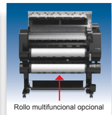
Rollo multifuncional opcional