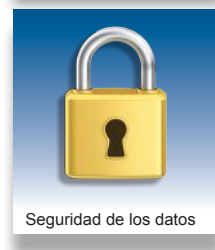
Seguridad de los datos