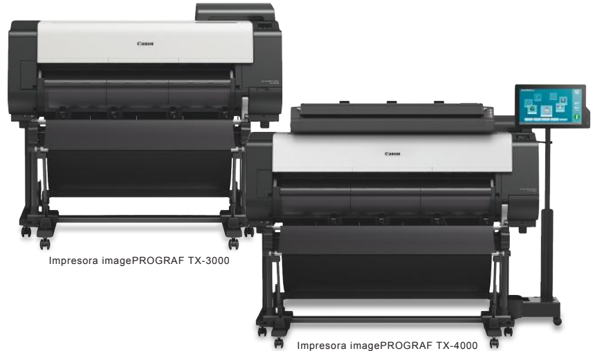
Impresora imagePROGRAF TX-3000